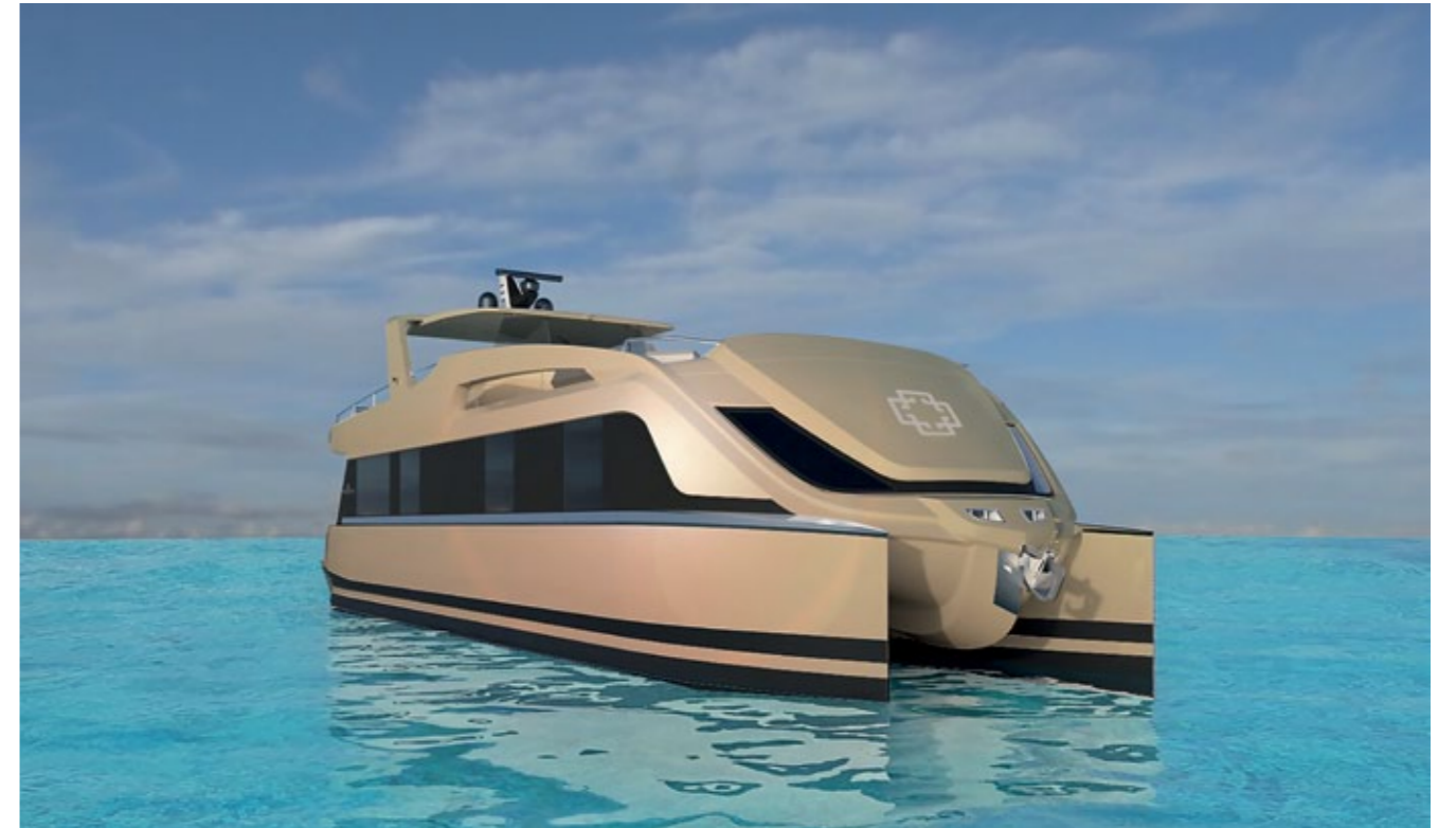
Auf dem 20 Meter langen Luxus-Katamaran der Hütter Bönan Hotels lassen sich die Balearen auf einzigartige Art und Weise entdecken.

mit Designer-Bar und einem Loungebereich, der auch als exklusiver Beachclub unter dem sternenfunkelnden Nachthimmel genutzt werden kann. Eigentümer des nagelneuen Powerboots sind Peter Hütter und seine Schwester Christine Hütter-Bönan, die bereits das Boutique Hotel Wachtelhof im Salzburger Land wie auch die Heidelberg Suites betreiben. Der Mietpreis für das gesamte Boot beginnt bei 5000 Euro pro Tag inklusive Betreuung durch einen Skipper und eine Servicekraft, eines Frühstücks an Bord, der Hafengebühren in Ibiza sowie der Endreinigung. Treibstoff sowie Speisen und Getränke sind exklusive. Ein Concierge, der sich um alle Belange der Gäste kümmert, kann vorab mit der Buchung von Extraleistungen beauftragt werden. Das Floating Boutique Hotel GOLDFINGER erstreckt sich über zwei Ebenen und umfasst 160 Quadratmeter. Auf dem Oberdeck befindet sich die 80 Quadratmeter große Fly Bridge, der Mittelpunkt des