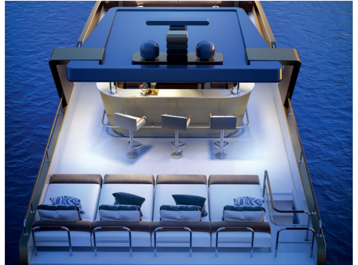
Auf der Fly Bridge laden Designer-Bar und ein exklusiver Loungebereich zu unvergesslichen Momenten unter freiem Himmel ein.